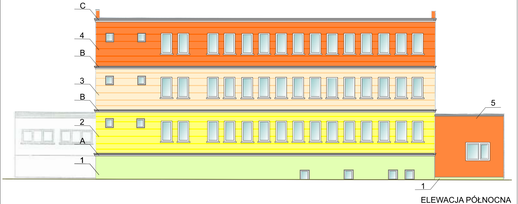
RYS. NR 2

ZASTOSOWAĆ PALETĘ KOLORÓW CERESIT LUB RÓWNOWAŻNĄ