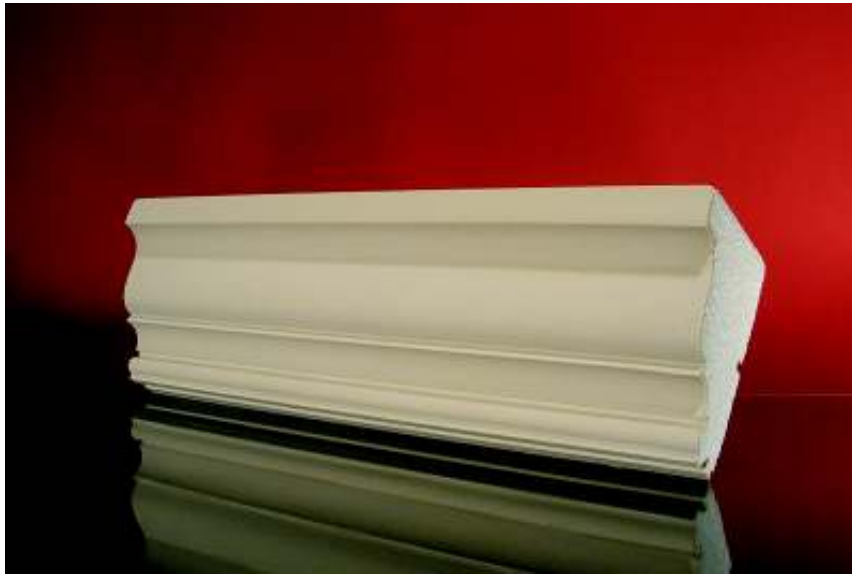
RYS. NR 4